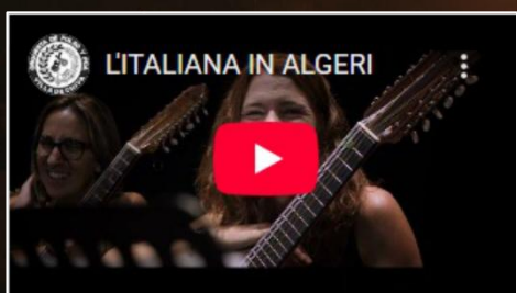
L'ITALIANA IN ALGERI - G. ROSSINI