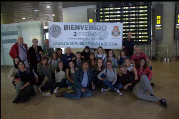
Tercer Premio Internacional Ala, Trento (Italia)