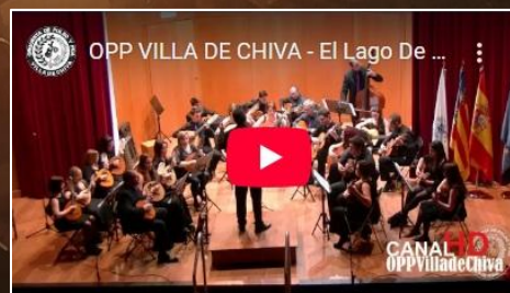
EL LAGO DE LOS CISNES - TCHAIKOVSKY