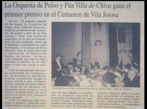
Primer Premio Certamen Nacional Vila Joiosa (Alicante)