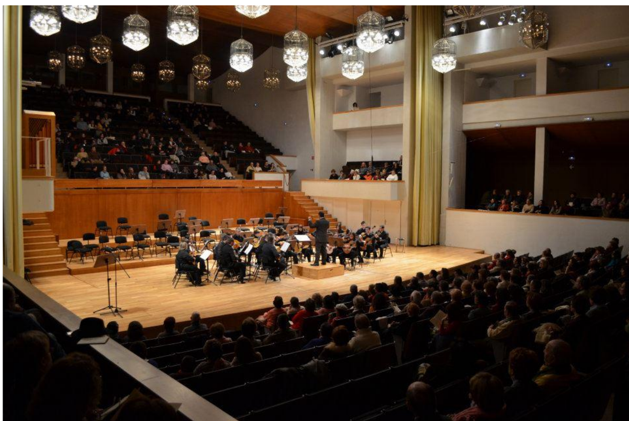
La OPP Villa de Chiva en el Auditorio Manuel de Falla de Granada, homenaje a Manuel de Falla.

Recientemente han estrenado el espectáculo “Sensaciones”, donde las imágenes y la música se funden con los sentidos del espectador, dando lugar a una experiencia músico sensorial inolvidable, siendo ovacionada en sus actuaciones, y recibiendo elogios tanto del público como de la crítica especializada.