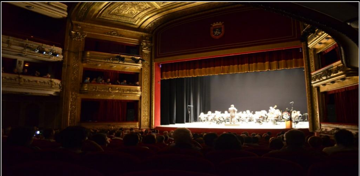
La OPP Villa de Chiva en el Teatro Principal Gayarre de Pamplona