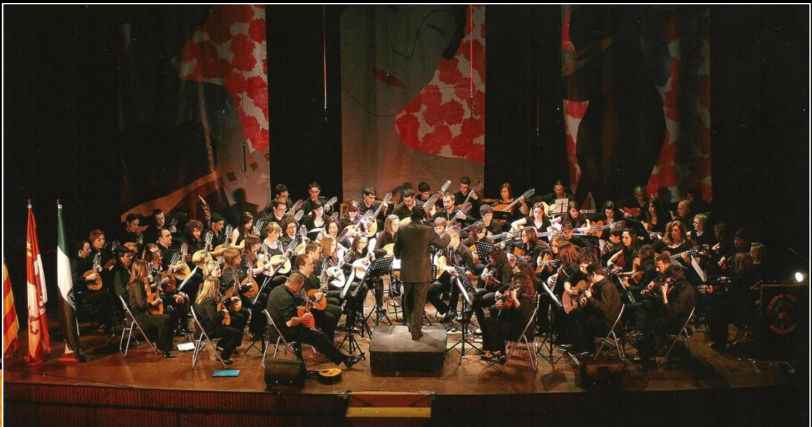
4 Teatro Astoria de Chiva - Festival Nacional de Orquestas de Pulso y Púa Villa de Chiva