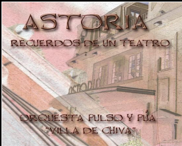
1º CD "Astoria, recuerdos de un teatro"