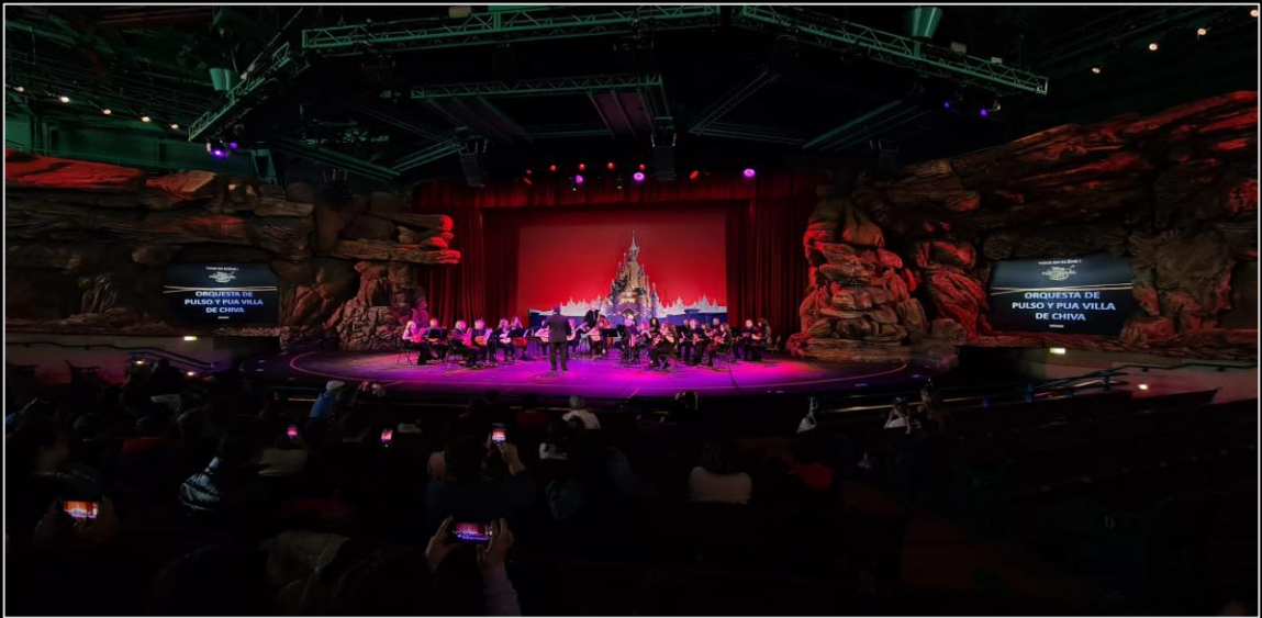
La OPP Villa de Chiva en el Teatro Interior Videopolis de Disneyland (París)