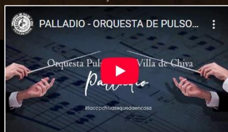
PALLADIO - K. JENKINS