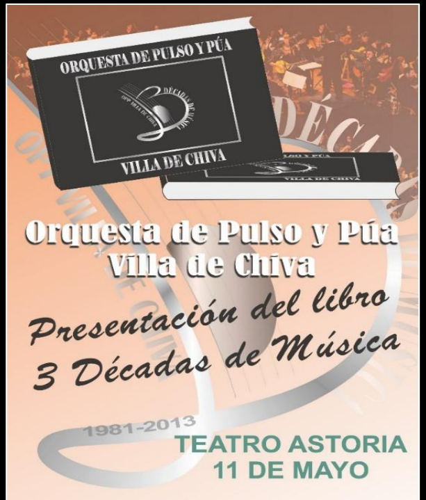
Publicación libro "Tres Décadas de Música"