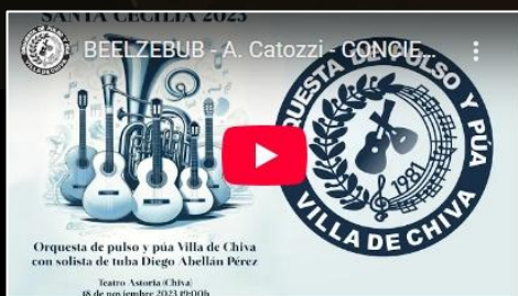
BEELZEBUB - A. CATOZZI